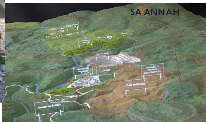
Lítio do Barroso – Centro de Informação e Maqueta