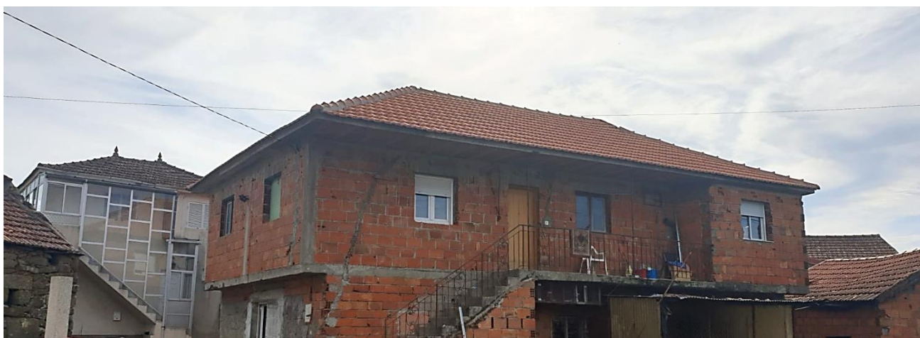
Reabilitação de Telhado em Casa de Covas do Barroso

Serão estas acções que iremos manter durante a nossa presença na região. Será sempre esta a marca que a Savannah irá deixar.