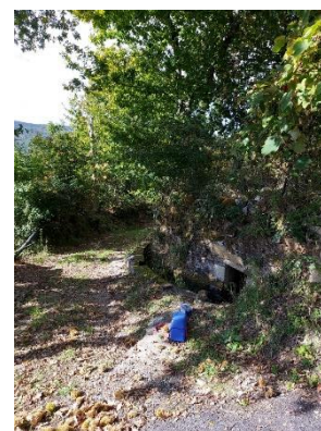
Trabalho de campo – Recolha de solo, desmonte e monitorização de vibrações