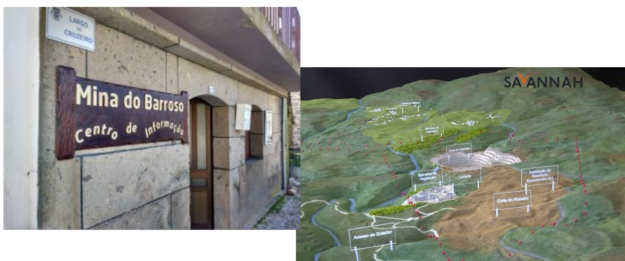
Mina do Barroso – Centro de Informação e Maqueta

Relembramos que o Centro de Informação à comunidade, em Covas do Barroso, tem disponível uma maquete 3D do projeto, que permite obter uma visualização mais aproximada da realidade de como será construído este projeto. É este o local ideal para conhecer em pormenor o projeto e conhecer os factos reais associados ao desenvolvimento do projeto da Mina do Barroso.